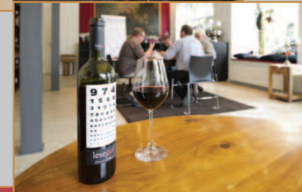
Weine mit Schwerpunkt Deutschland und den Mittelmeerländern