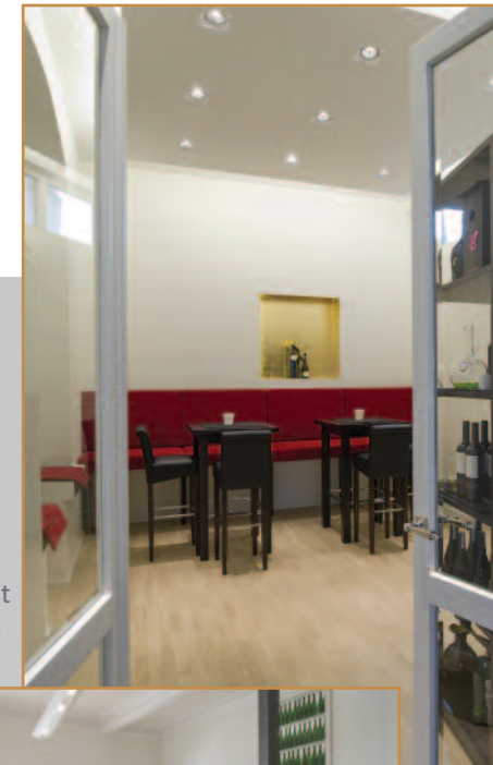
Kleiner Salon mit goldener Nische